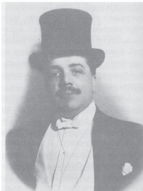
С.П. Дягилев. 1916.

Однако Дягилев был не намерен отвечать на несвоевременный вопрос Прокофьева о балетмейстере, пока он и сам не знал ответа. Дягилева заботило другое обстоятельство. Догадываясь или зная, что прокофьевский балет еще не написан, ему хотелось, чтобы новое произведение родилось под его присмотром и при его участии, как это и было всегда в антрепризе «Русский балет». Рассудительный Дягилев решил действовать наверняка, подумав, что вряд ли молодой композитор откажется от его заманчивого предложения. Из Флоренции он отправил 27 октября (н. с.) на петроградский адрес Прокофьева телеграмму: «Могли бы вы приехать в Рим через Салоники с клавиром нового балета. Желали бы вы играть ваш второй концерт в Риме. Могу постараться устроить. Дягилев» 11 .